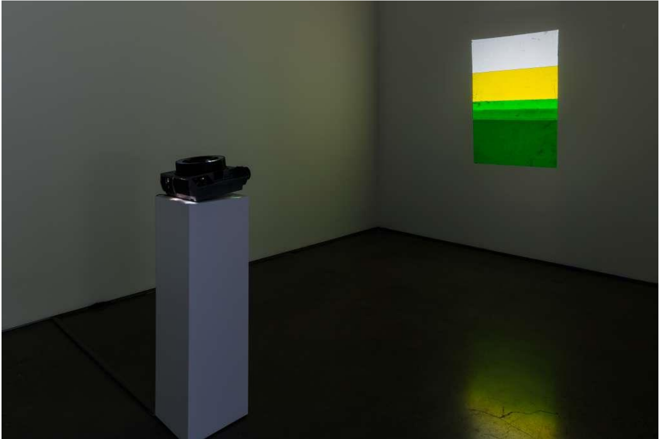
Ejercicios con diapos, 2013, de Francisco Ugarte en Cristin Tierney, Chelsea.

La suya es una propuesta que se afina en una intercepción. Arte en la frontera de la tecnología y la ciencia, pero también gesto de modernidad que hace portable la tradición , la miniaturiza, la pasa de contrabando, garantizando así su viabilidad dentro de los nuevos paradigmas. Parece simple, partiendo incluso de su economía de recursos: transparencias, proyectores, tapes y escarpelos , pero ya decía Bukowsky que “un artista expresa las cosas complicadas de una manera simple”. En Ugarte colisionan las teorías de una modernidad líquida, hipertrofiada y evasiva, contra el rescate de una sólida práctica estética vanguardista: el abstraccionismo geométrico, que vive su nuevo apogeo. También se registran en un mismo acto lo efímero de esos tapices de luz, como reflejo de un soporte eléctrico, frente a las cualidades de alta preservación de la fotografía positiva.